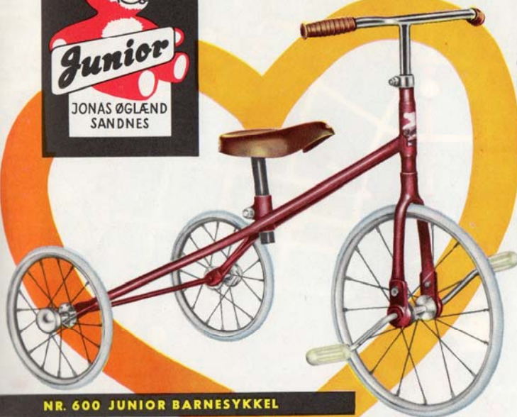
NR. 600 JUNIOR BARNESYKKE

Ønskesykkelen for alle småbarn. Solid utførelse, forhjul med kulelager. 3/8" gummiring foran og bak. Førsteklasses lakkering i blått eller rødt. Med eller uten lasteplan i aluminium. Pedalaksel og bakaksel er «kledd inne» for å hindre oppskraping av møbler o. l. Leveres også i spesialmodeller for cerebral parese pasienter (nr. 620) og hoffestøtter (nr. 640). Vi sender gjerne spesialprosjekt