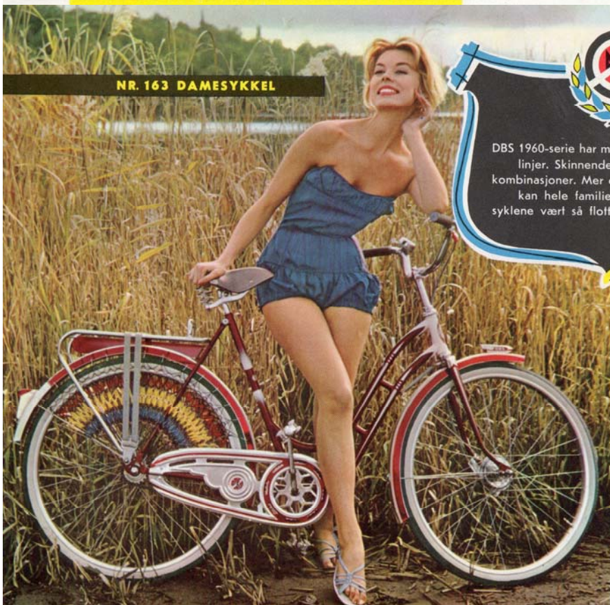
NR. 163 DAMESYKKELE