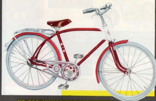
NR. 500 JUNIOR DBS GUTTEMODELL