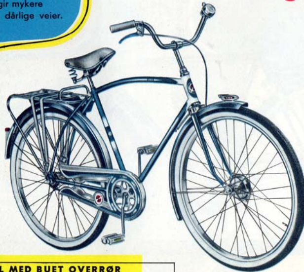
NR. 213 HERRESYKKELE MED BUET OVERRØR

Dette er den ideelle sykkelen for gutter fra 11 års alderen og oppover, og for menn under gjennomsnittshøyde. Legg spesielt merke til den fine strømlinjeformen i rammen.